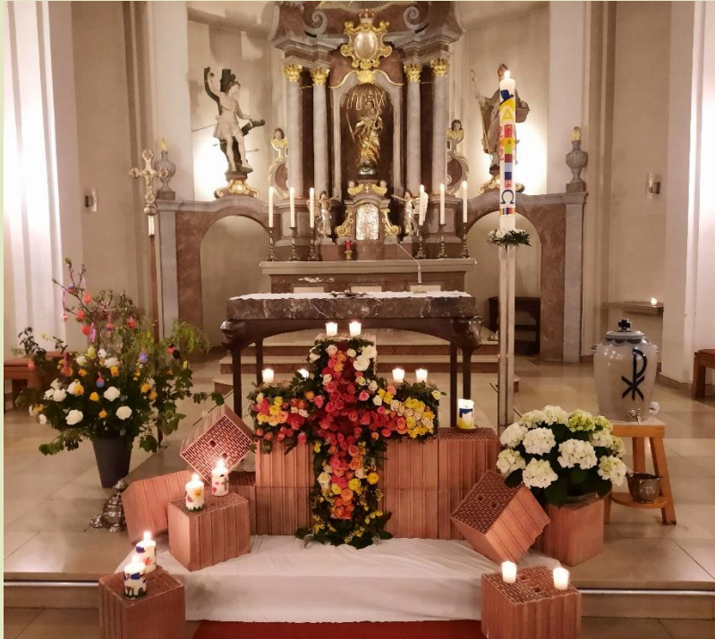
Altarraum in St. Antonius am Ostersonntag

D as Ostergeschehen sprengt die Klagemauer, das Leben gewinnt, der Tod hat nicht das letzte Wort und die Klage verwandelt sich in Lobpreis. Halleluja, Jesus lebt! Das Kreuz erblüht.