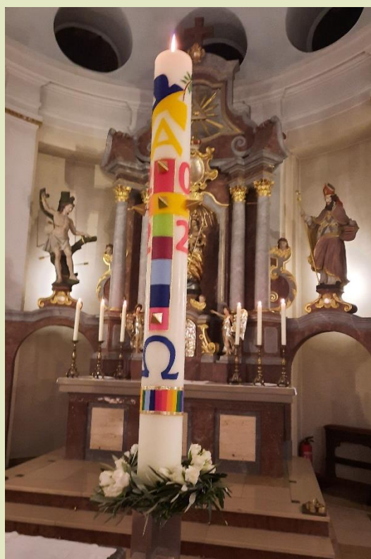
Osterkerze in Pfungstadt

Die Osterkerzen sind wunderschön geworden! Vielen Dank liebe Messdienerinnen und Messdiener!!